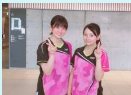
R 1 . 7 月 西三選手権 ダブルス ベスト8