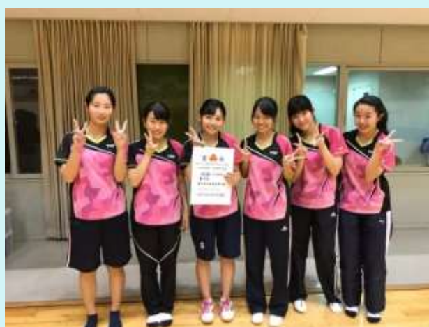
H 3 0 . 秋 新人戦 西三大会 女子団体 ベスト4 県大会出場