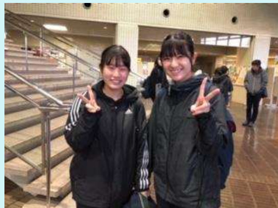
R 1. 12月 県強化練習会 一次・二次