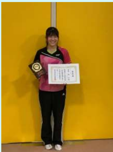
R 2. 1月 愛知県新春新人卓球大会 ブロック優勝