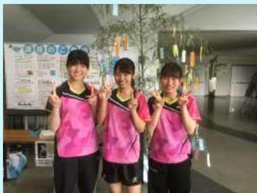
R 1 . 6 月 国体 県大会出場