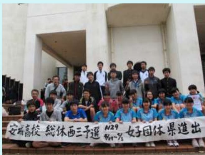
H 2 9 . 春 総体 西三大会 女子団体 ベスト8 県大会出場