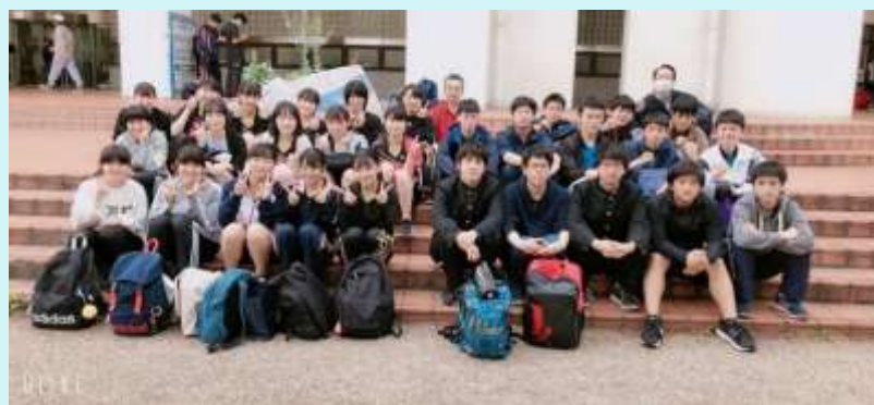
H 3 1 . 春 総体 西三予選 女子団体・シングルス・ダブルス 県大会出場