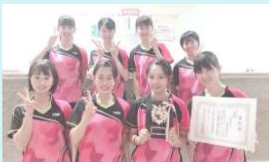
R 1 . 8 月 西三リーグ 4部優勝 3部昇格