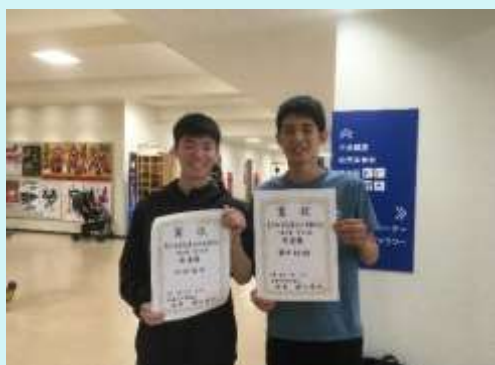
H 3 1 . 5 月 安城市A B C 級卓球大会 入賞