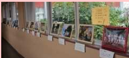
← 【写真部】 ↓