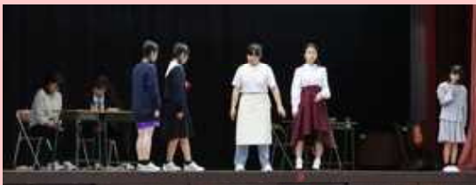
↑ 【演劇部】 ↓ 【吹奏楽部】