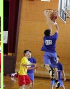
【バスケットボール】