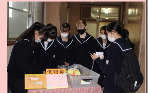
↓ 【書道部】 ↑ 【食物部】