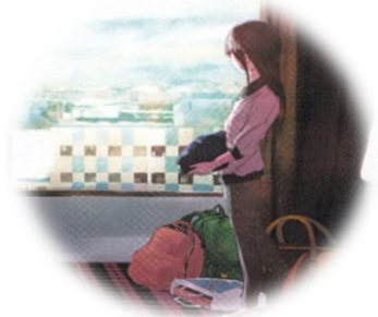
修学旅行 (宿泊先部屋内での一場面)

A 本校夜間定時制課程には、中学校時代に不登校経験のある生徒が数多くいます。入学後は、少人数できめ細かな指導を受けることができます。中学校での欠席日数が多いことだけで、本校の入試に不利になることはありません。本校の定時制課程で学び直したいという気持ちがあれば、ぜひチャレンジしてください。