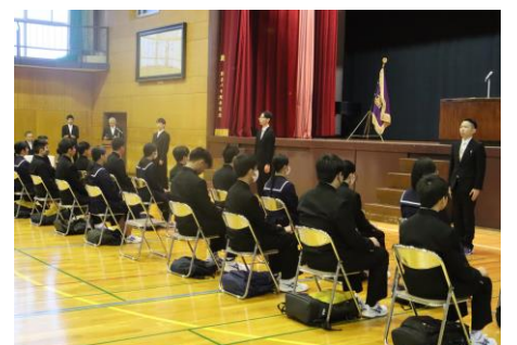
令和6年度入学式の様子