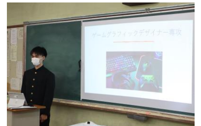
総合的な探究の時間（発表）