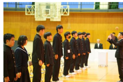
令和5年度卒業証書授与式

ただし、入学後の授業は日本語で行いますので、入学前には日本語を「聞く・読む・書く」といった力はある程度身に付けておくことと良いでしょう。地元などにある日本語教室であらかじめ勉強しておくことをお勧めします。