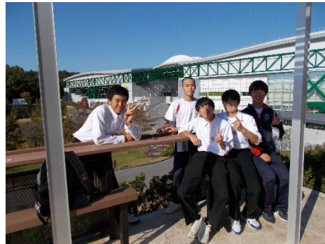
「借りぐらしのアリエッティ」