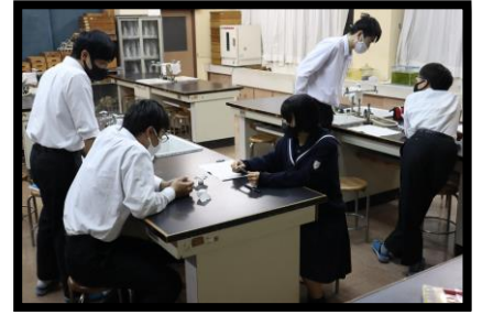
令和4年度3年化学基礎授業(実験)