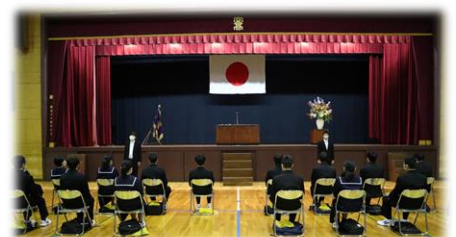
令和5年度入学式の様子