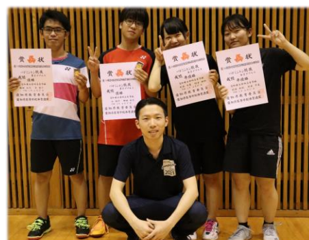
令和5年度定通高校総体 バドミントン部