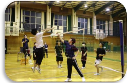
令和4年度 球技大会