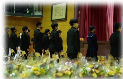
令和4年度卒業証書授与式

ただし、入学後の授業は日本語で行いますので、入学前には日本語を「聞く・読む・書く」といった力はある程度身に付けておくことと良いでしょう。地元などにある日本語教室であらかじめ勉強しておくことをお勧めします。