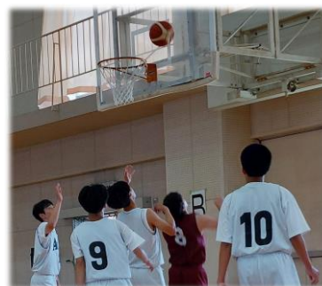
令和5年度定通高校総体 バスケットボール部