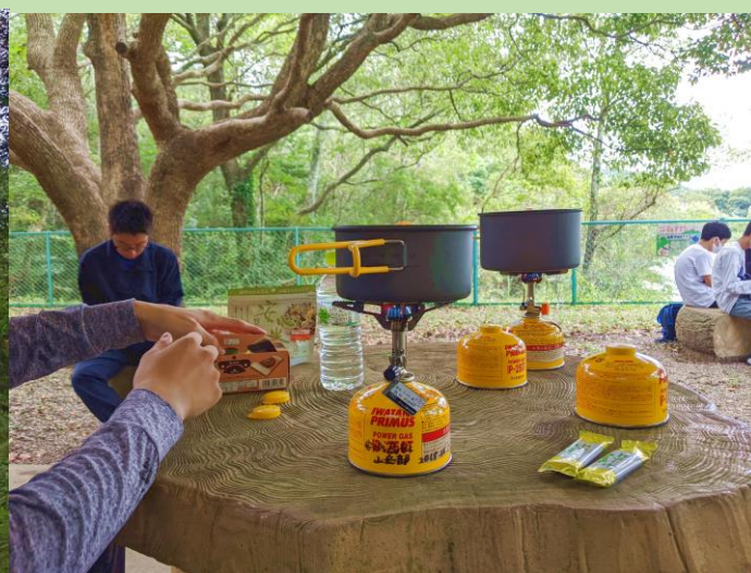
下山後、昼食。山で食べるカップ麺は美味しいです。