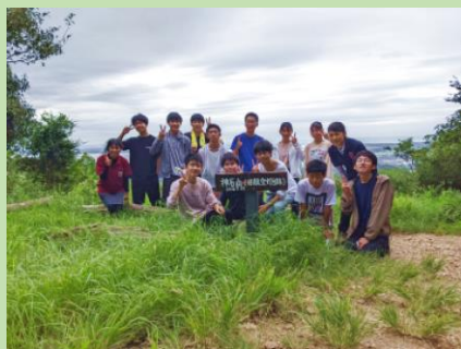
神石山頂上。全員で記念写真