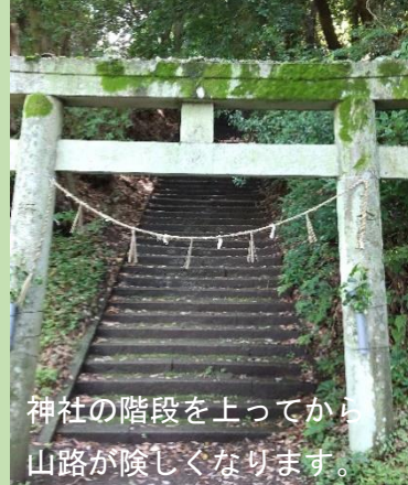
神社の階段を上ってから山路が陰しくなります。