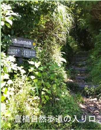
豊橋自然歩道の入り口

第2回目の登山参加者は、11名。当日は快晴で風が吹いていたので、それほど暑さを感じませんでした。周囲に高い山がないので、山頂では360度を見渡す素晴らしい景色を楽しむことができました。