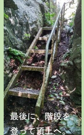
最後に、階段を登って頂上へ。