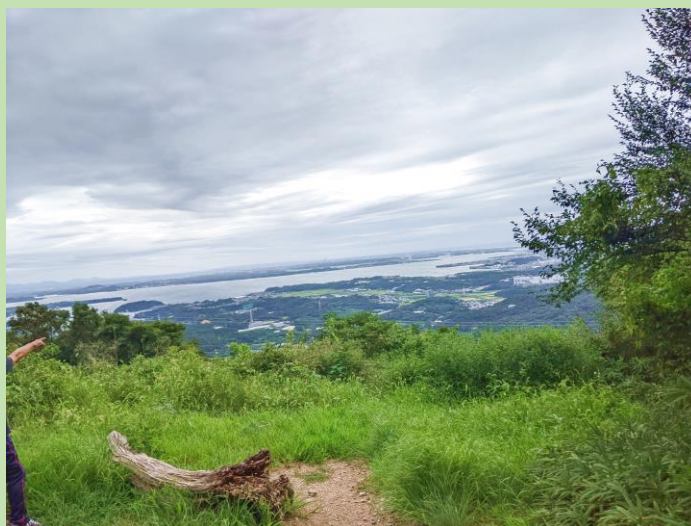
山頂からの景色。曇天。浜名湖が見えました。