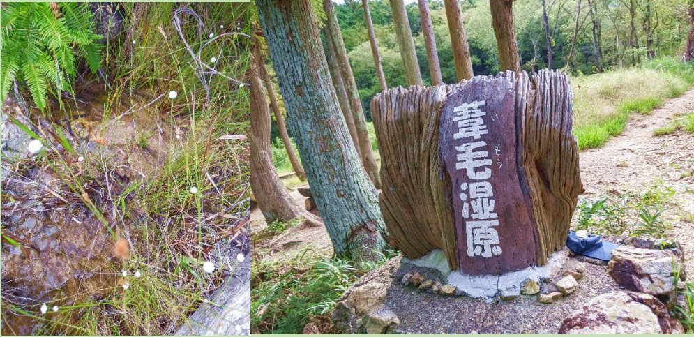
湧水湿原としては国内最大級の広さを誇る葦毛湿原。