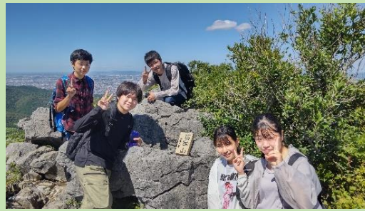
山頂は狭いので、2グループに分かれて記念写真。