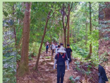
涼しい一日でした。