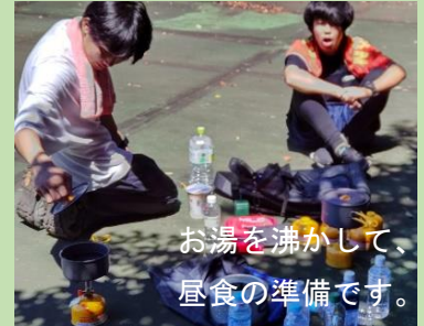
お湯を沸かして、昼食の準備です。