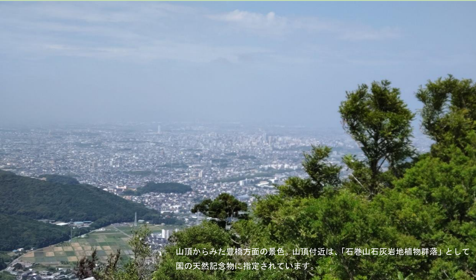
山頂からみた豊橋方面の景色。山頂付近は、「石巻山石灰岩地植物群落」として国の天然記念物に指定されています。