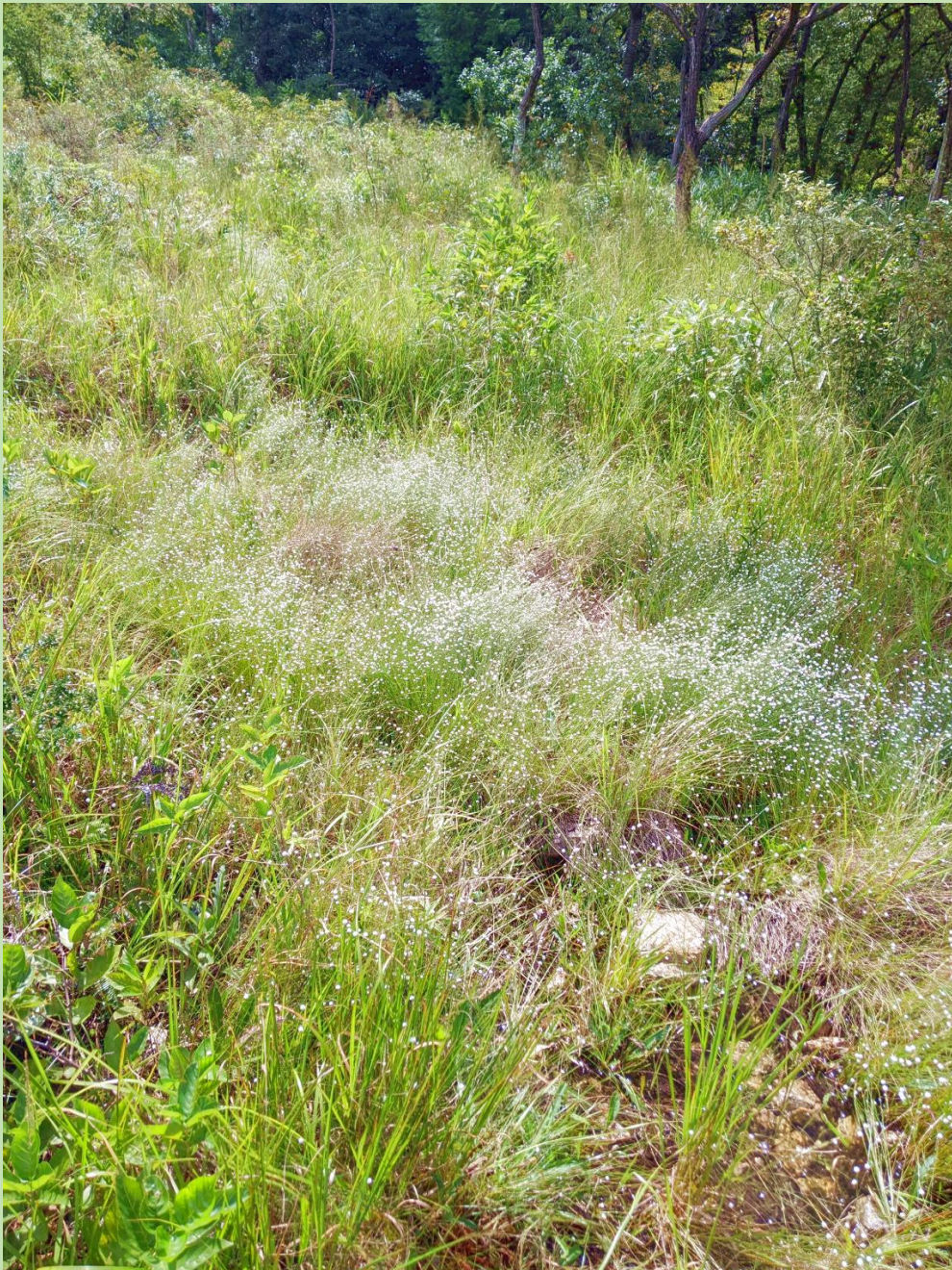
シラタマホシクサがきれいでした。