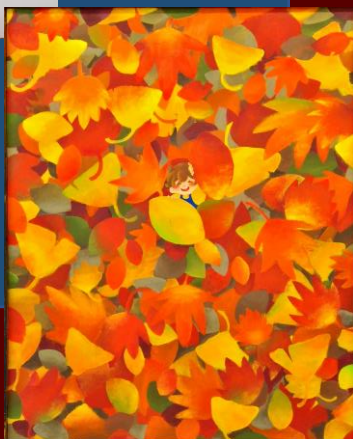
アクリル/キャンバス