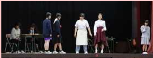
↑ 【演劇部】 ↓ 【吹奏楽部】