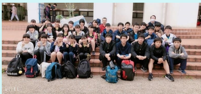
女子団体・シングルス・ダブルス 県大会出場