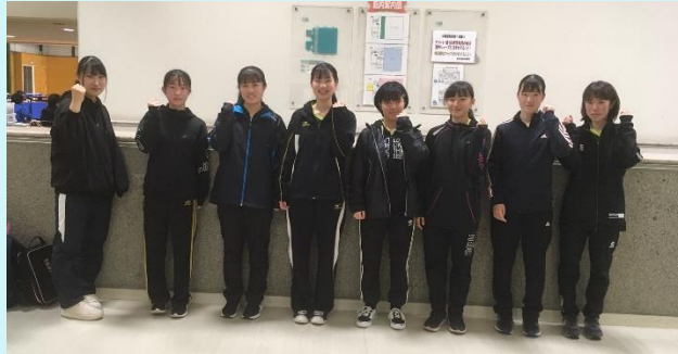
R 3 愛知県総合体育大会卓球競技 西三河支部予選会