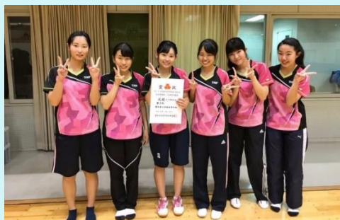
H 3 0. 秋 新人戦 西三大会 女子団体 ベスト 4 県大会出場