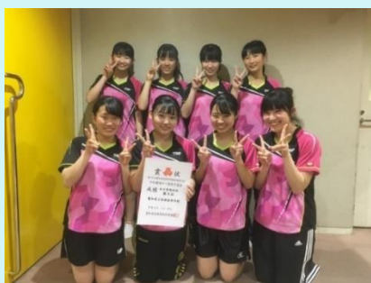
H 3 1. 春 総体 西三予選