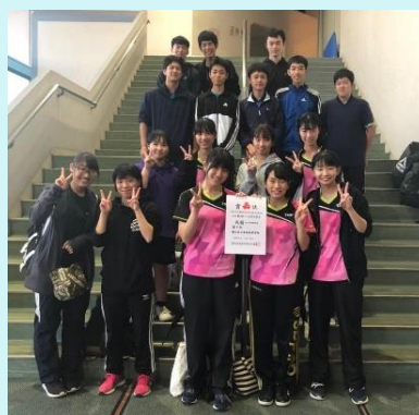
R 1 10月 新人戦 西三予選 女子団体 7位 県大会出場