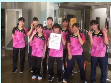
R 2 10月 新人戦 西三予選 女子団体 8位