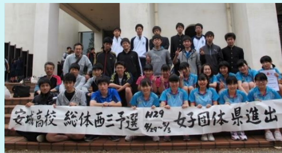
H 2 9. 春 総体 西三大会 女子団体 ベスト 8 県大会出場